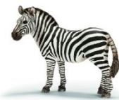
Party Service Zebra