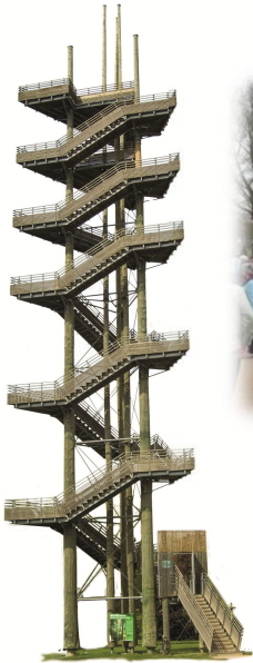
Turmsteigen Tägliche IVV Sonderwertung