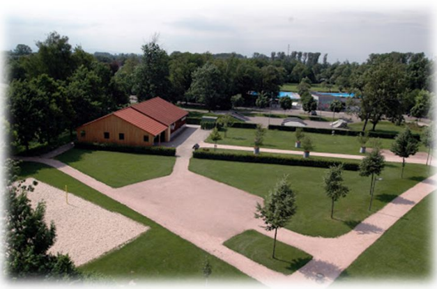
Start / Ziel: Feldscheune